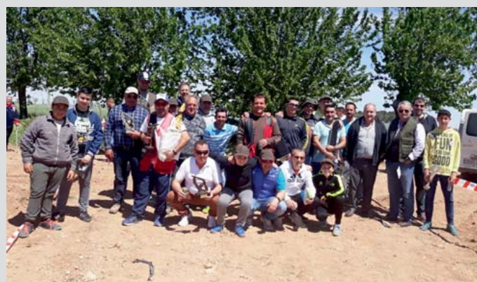
Club de Tiro al Plato y comida popular

ORGANIZA: Concejalía de Cultura y Festejos.