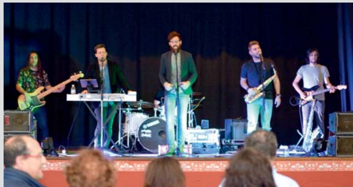
Concierto del Grupo 'Planeta 80'.